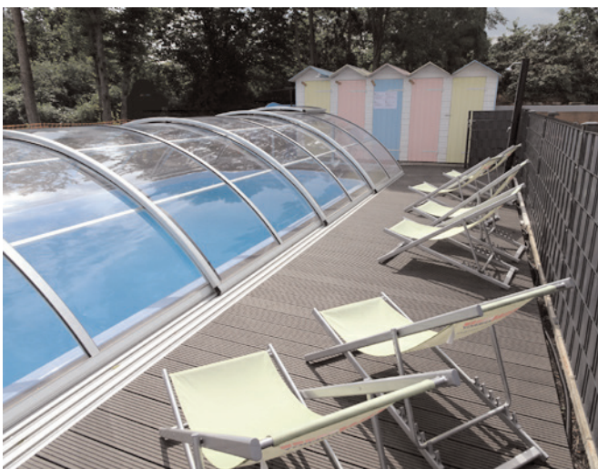
Der überdachte Pool mit Gegenstromanlage

Wie ist es dazu gekommen? Ein zweites sportliches Standbein neben dem Tennissport, hat sich mit der noch in Deutschland jungen Sportart „Padel Tennis“ etabliert. International sind daher auch viele der neuen 110 Vollmitglieder, die zum Teil aus Spanien und Holland kommen. Die Anlage besteht aus zwei modernen Padelplätzen mit Flutlicht, einer gediegenen Gastronomie und einem kleinem Pool mit Gegenstromanlage. Für die Zuschauer gibt es zwischen den Plätzen einen großzügigen Loungebereich und eine Dachterasse mit Baranlage, die einen tollen Blick auf die Padelplätze ermöglicht.