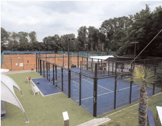
Ausblick von der Dachterasse

Ein wahren Mitgliederboom kann der Tennisclub vom Neusser Weg in Düsseldorf verzeichnen. Rund 300 neue Mitglieder und eine massive Verjüngung in den Altersgruppen zwischen zwanzig und vierzig Jahren sind in den Verein eingetreten.