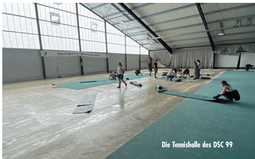
Die Tennishalle des DSC 99